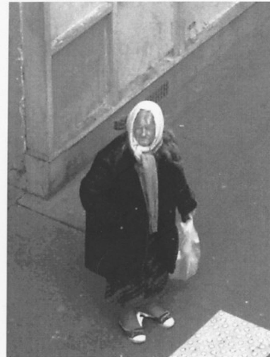
Sans titre, rue de Meaux, Paris, 2008